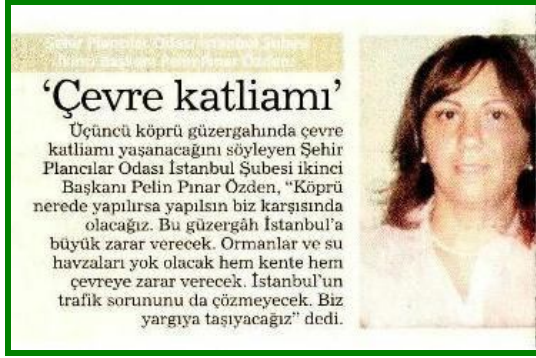
Habertürk – 20.08.2009