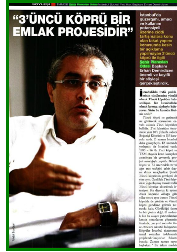
Otohaber - 07.09.2009

Bugün TV 17:00 Bülteni- 19.08.2009 CNN Türk - 18:00 haberleri - 19.08.2009 RADYO CCN Türk - 360 Derece Programı - 19.08.2009 CNN Türk - 23:00 haberleri - 19.08.2009 KANAL T 13:00 haberleri - 20.08.2009 NTV - 10:00 haberleri - 20.08.2009 NTV - 11:00 haberleri - 20.08.2009 Best FM - Gazoz Ağacı Programı - 20.08.2009 NTV Yakın Plan - 20.08.2009 SKYTURK İşin Aslı Programı - 20.08.2009 Kanal 24 - 24 Sabah Programı - 21.08.2009 NTV Güne Başlarken - 21.08.2009