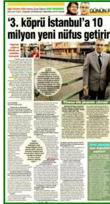
Habertürk - 14.09.2009