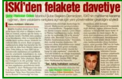
Tercüman – 13.09.2009

Habertürk Akşam Haberleri – 14.09.2009 Habertürk – 1 GÜN – 14.09.2009 SkyTürk İki Nokta Programı – 14.09.2009 CNN Türk – Yenigün – 15.09.2009 HaberTürk Uyandırma Servisi – 15.09.2009 Kanal T – Nurseli İdiz'le Gecelik Haberler – 15.09.2009 CNN Türk ÖZEL YAYIN – 16.09.2009 Habertürk Akşam Haberleri – 16.09.2009 SkyTürk – Kırmızı Bülten – 28.09.2009