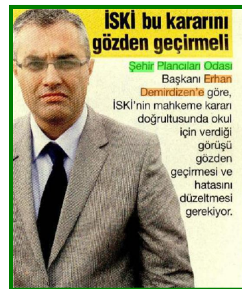
Habertürk – 20.09.2009

Sel felaketi sonrası Basının ilgi odağı haline gelen Ayamama deresi çevresinde İSKİ'nin dere yatağına 25 m.lik koruma bandı önermesiyle ilgili Habertürk'e konuşan başkanımız şu açıklamayı yaptı: "İSKİ yönetmeliğine göre dere yatağı civarında her iki yönde de 100 metre koruma bandı olması gerekiyor. Fakat yönetmelikte esnek bir cümle vardı ve bu bandı düşürüyordu. Biz de Şehir Plancıları Odası olarak işte bu cümleye dava açtık. Koruma mesafesinin 100 m. olması şart."