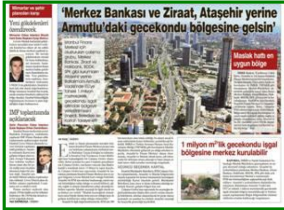
Milliyet – 04.09.2009