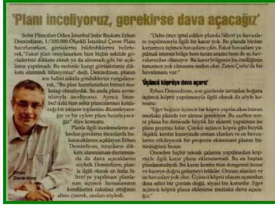
Milliyet – 08.08.2009

Temmuz ayında İBB’de askıya çıkan ve askı süresinde itiraz ettiğimiz İstanbul Çevre Düzeni Planı hakkında Milliyet Gazetesine açıklamalar yapan planın tartışmalı noktalarına değinerek Oda içinde üyelerimizle yapılacak toplantılarda bir eylem planı yapılacağını ve gerekirse planın dava edileceğini belirtti.