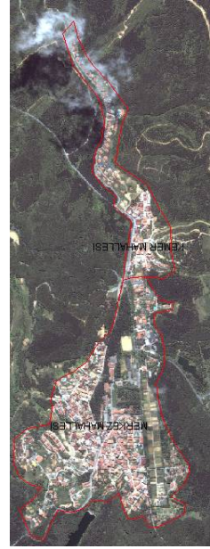
Kaynak: 19 Şubat 2009 tarihli 1/5000 ölçekli Bahçeköy Koruma Amaçlı Nazım İmar Planı” toplantı sunuşu